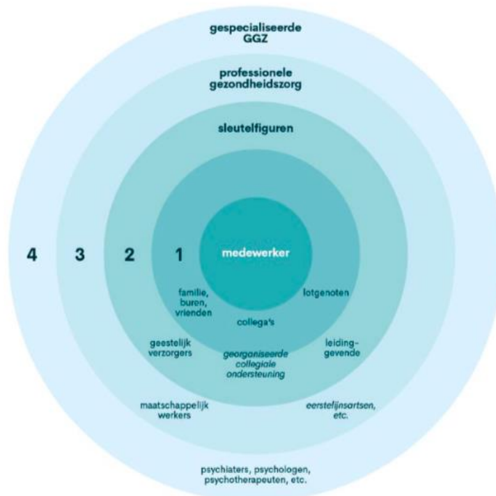
Figuur 3 – kringenmodel

inspirerend en dienend leiderschap. Tevens is er aandacht voor het verminderen van risicofactoren, zoals werkdruk, emotioneel zwaar werk en procedurele en relationele onrechtvaardigheid binnen de organisatie.” Goed herstel is dus geen kwestie van incidentele maatregelen alleen, maar ook van goed structureel beleid.